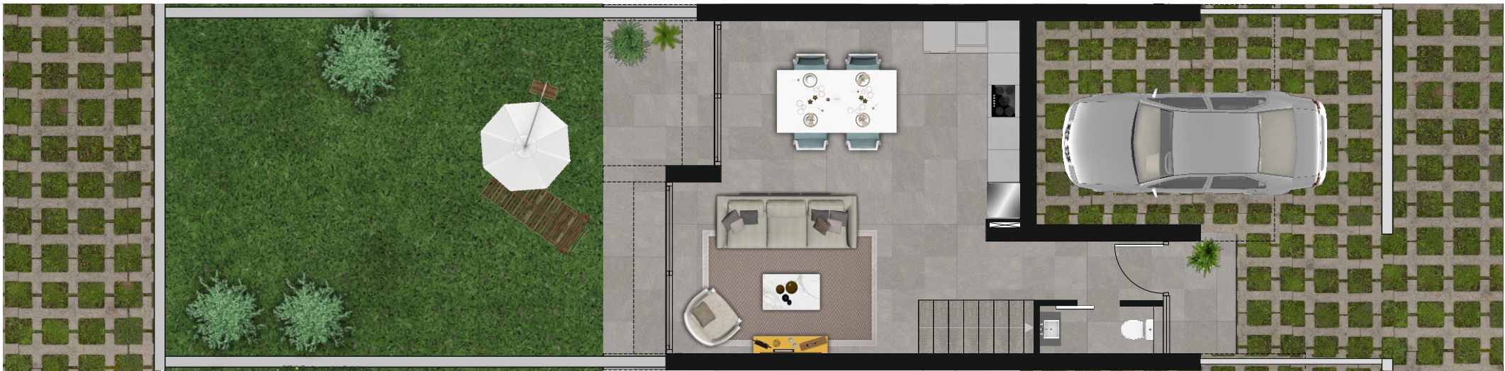
Vivienda 8 Planta baja