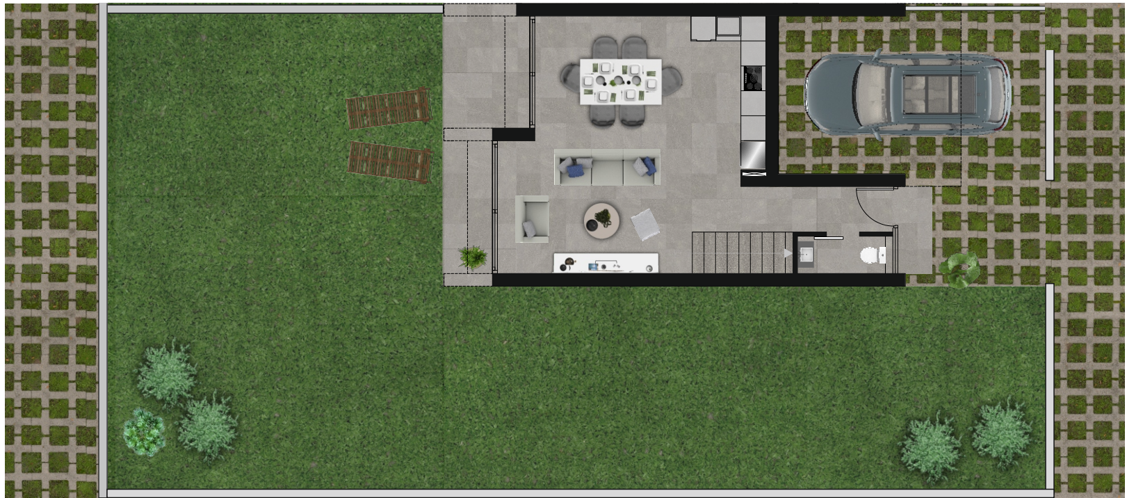
Vivienda 13 Planta baja