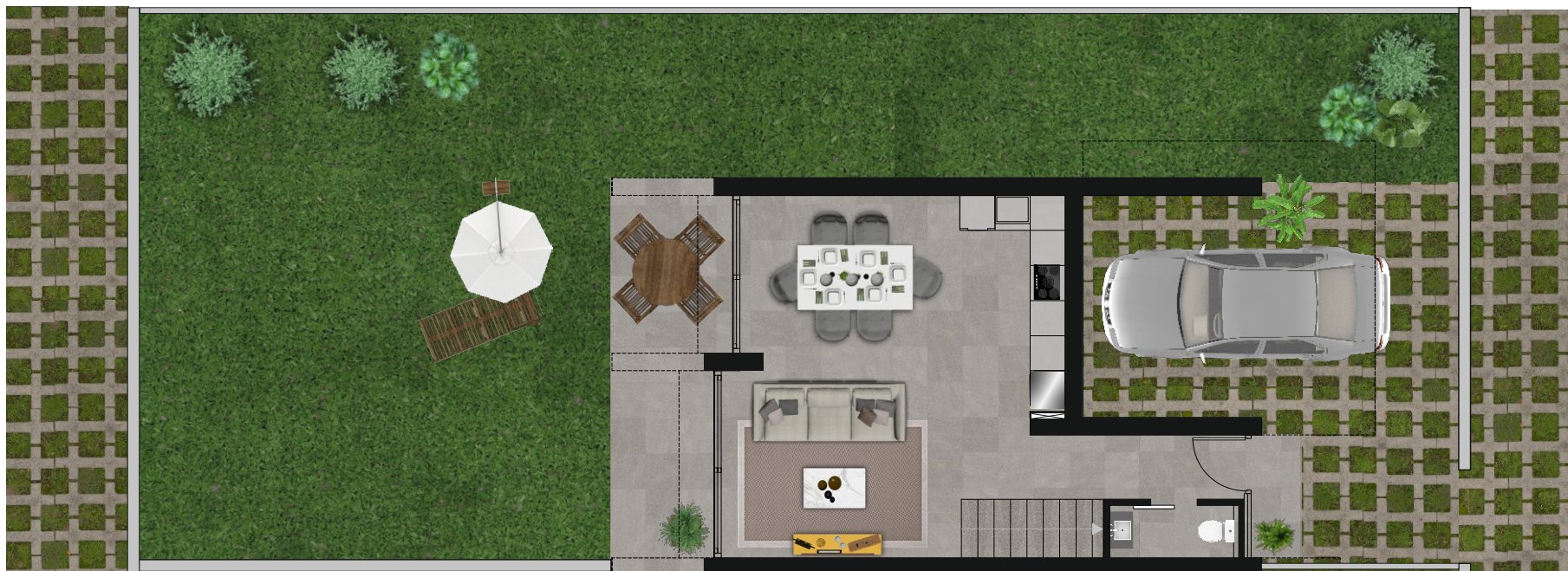
Vivienda 14 Planta baja